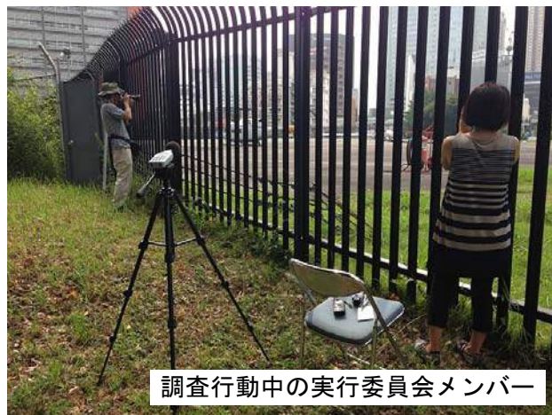
調査行動中の実行委員会メンバー

この日飛来したのべ6機のヘリのうち、規定通りにヘリパッドを使って着陸・離陸した機はゼロ。駐機時にエンジンを止めた機もゼロ。最長45分間にわたってアイドリングを続け、騒音と排気ガスを撒き散らかしていました。