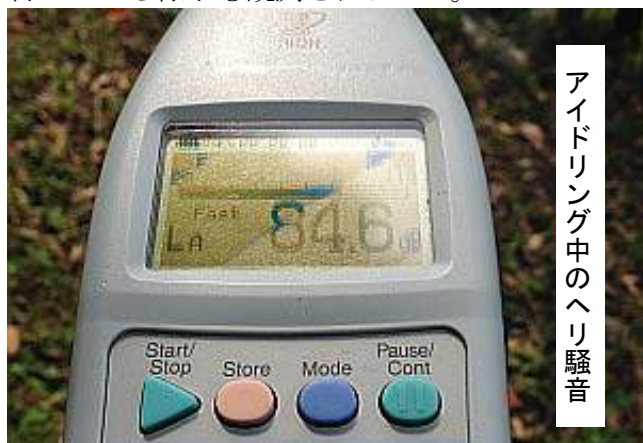
アイドリング中のヘリ騒音

なお、昨年明らかになった横田基地から六本木ヒルズまでの訓練空域で、今回キャンプ座間所属と見られるブラックホークが東京上空を訓練飛行している様子も観測されました。