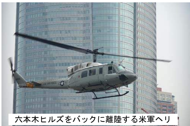
六本木ヒルズをバックに離陸する米軍ヘリ

のべ6名が参加し、基地に隣接する青山公園で早朝7:00～夕方7:00までカメラやビデオによる記録と、港区から借り受けた騒音計2台を用いた騒音測定も行いました。