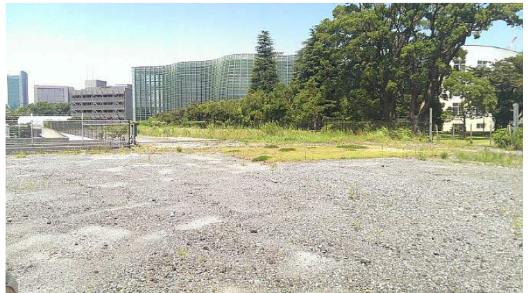
一部返還された基地跡地から北側を見る。中央建物は国立新美術館、その左は学術会議、右は旧東大生研

実に感慨深い立ち入りとなりました。基地との新しい境界となるフェンスに近づくと、そこはヘリ駐機場のP2のすぐそばであることがわかりました。公園として整備されたらすぐそばで監視行動ができそうです。（K）