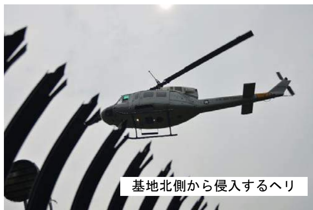
基地北側から侵入するヘリ