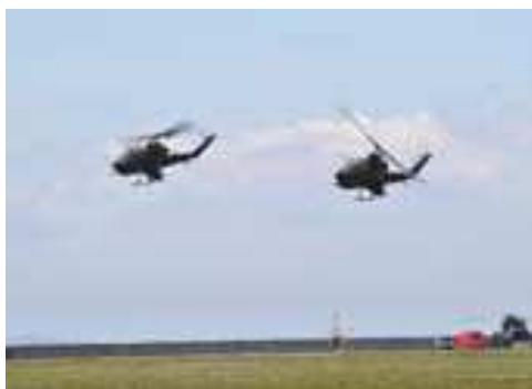
11月6日午前10時半ごろ祖師谷で撮