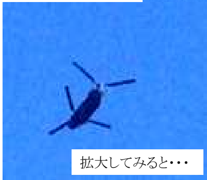
拡大してみると・・・