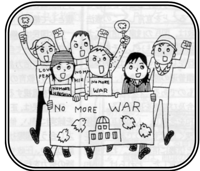
成城地域「九条の会」

第九条(戦争の放棄) 日本国民は、正義と秩序を基調とする国際平和を誠実に希求し、国権の発動たる戦争と、武力による威嚇又は武力の行使は、国際紛争を解決する手段としては、永久にこれを放棄する。前項の目的を達するため、陸海空軍その他の戦力は、これを保持しない。国の交戦権は、これを認めない。