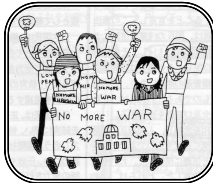
成城地域「九条の会」